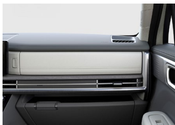
Šedý Supersonic Gray interiér - šedé čalounění sedadel - světlé čalounění stropu - světlé provedení bočních sloupků - šedé provedení výplní dveří