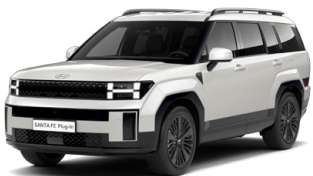
Creamy White Perleťová Cena: 24 900 Kč