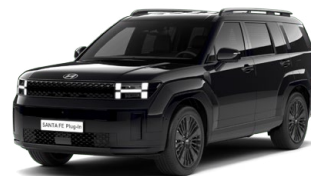
Abyss Black Perleťová Cena: 24 900 Kč