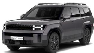
Magnetic Gray Metalická Cena: 19 900 Kč