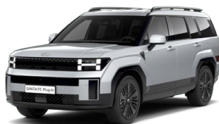
Typhoon Silver Metalická Cena: 19 900 Kč