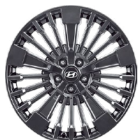
Calligraphy 20" kola z lehké slitiny

www.porovnejhyundai.cz (Porovnejte si vozy Hyundai s konkurencí)