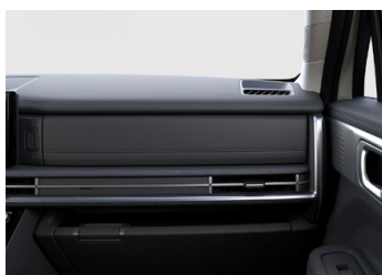
Černý Obsidian Black interiér - černé čalounění sedadel - světlé čalounění stropu - světlé provedení bočních sloupků - černé provedení výplní dveří