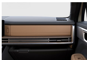
Hnědý Pecan Brown interiér - hnědé čalounění sedadel - černé čalounění stropu - černé provedení bočních sloupků - hnědo-černé provedení výplní dveří