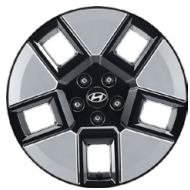
18" kola z lehké slitiny