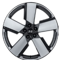
20" kola z lehké slitiny