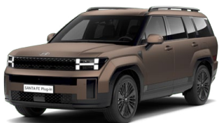
Earthy Brass Matt Matná Cena: 34 900 Kč