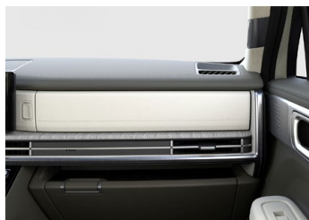
Tmavě zelený Forest Green interiér - krémové čalounění sedadel - světlé čalounění stropu - světlé provedení bočních sloupků - tmavě zelené provedení výplní dveří