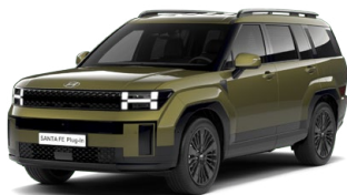
Ocado Green Perleťová Cena: 24 900 Kč