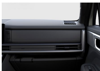
Prémiový černý Calligraphy interiér - černé čalounění sedadel z prémiové Nappa kůže - černé čalounění stropu - černé provedení bočních sloupků - černé provedení výplní dveří