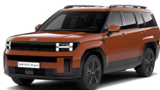
Terracota Orange Pastelová Cena: 0 Kč