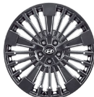
Calligraphy 20" kola z lehké slitiny

www.porovnejhyundai.cz (Porovnejte si vozy Hyundai s konkurencí)