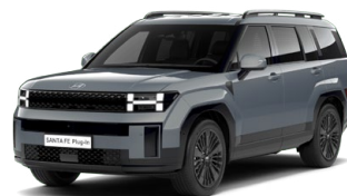
Pebble Blue Perleťová Cena: 24 900 Kč