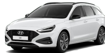
Serenity White Pearl Perleťová Cena: 16 900 Kč