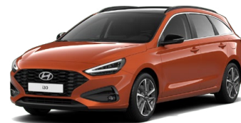
Jupiter Orange Metallic Metalická Cena: 16 900 Kč