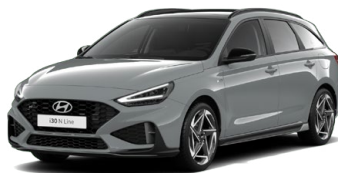
Shadow Gray Pastelová Cena: 16 900 Kč Dostupná pouze pro výbavy N Line