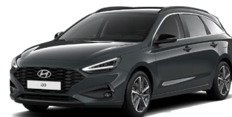
Cypress Green Pearl Perleťová Cena: 16 900 Kč