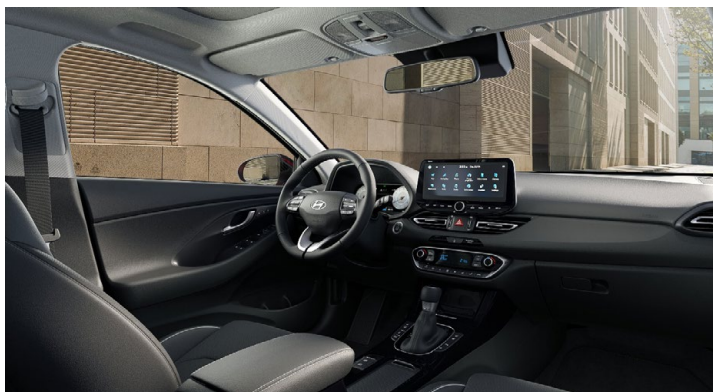
Černý interiér Oceanidis Black – látkové čalounění sedadel – světlé čalounění stropu a obložení bočních sloupků – černé provedení přístrojové desky a výplní dveří