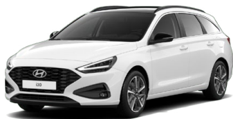
Atlas White Pastelová Cena: 5 900 Kč