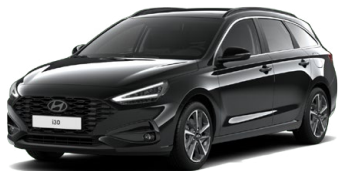
Abyss Black Pearl Perleťová Cena: 16 900 Kč