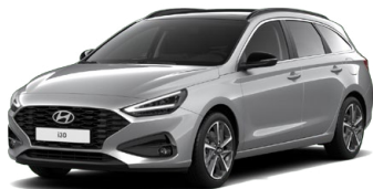
Shimmering Silver Metallic Metalická Cena: 16 900 Kč