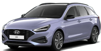
Meta Blue Pearl Perleťová Cena: 16 900 Kč