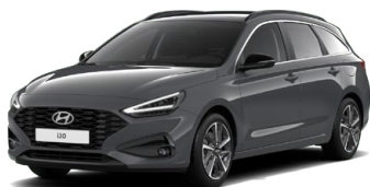
Ecotronic Gray Pearl Perleťová Cena: 16 900 Kč